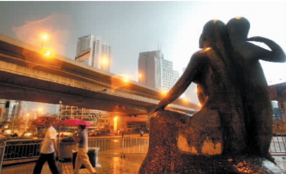
▲昨日16:31,天空黑压压的,中山一路高架桥上提早开了路灯。