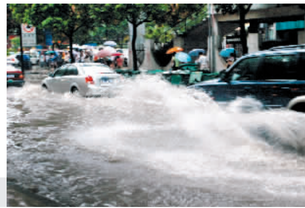
►暴雨过后多处积水。

时报讯 (记者 徐毅儿 刘谷华 涂峰 见习记者 杨昱 段一鸣 实习生 潘敬文 通讯员 林良勋 时雨) 昨日午后到晚上,广东省中西部地区自西向东出现了短时强降雨,局部地方还伴有8级左右的短时雷雨大风和强降水。下午5时前后,暴雨袭穗,广州市区天空漆黑如夜。