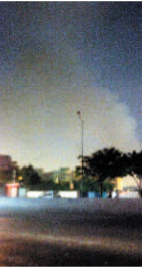
白色烟雾有数十米高。

方向。事发地是距大观路口500米处,在其附近还有一油库,由于化学品爆炸,油库随即关闭。