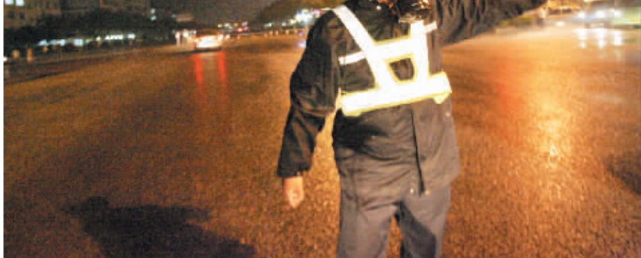
▲戴着防毒面具的交警指挥疏散,左上角为大观路化学品仓库爆炸示意图。