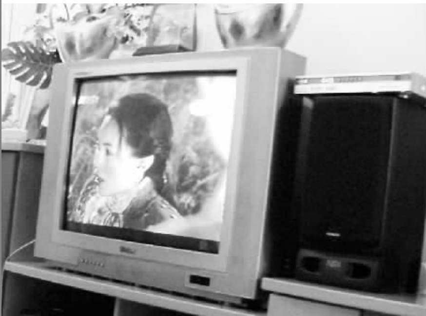
金碧花园部分住户已装上数字电视。电视机一侧音箱上放的就是机顶盒。

而对于前不久物价部门限价最高不得超过26.5元标准,记者随机采访该小区数名居民,多数表示涨价不超过9.5元尚能够接受,比最初听证会讨论的30元有所降低。刘女士表示:“涨了9块5还不算高,可以接受,但是还是希望最好不要最终核定最高点,谁不希望少点呀。”