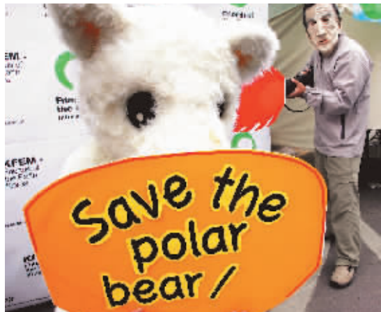
由于全球变暖,北极熊已经面临生存危机,近日有环境保护主义者穿上北极熊的装束,呼吁人们救救它。

据悉,由于制药行业发达,因此英国实验用豚鼠的需求量较大。许多有名的制药公司自然成了动物保护组织攻击的目标,而且英国的激进动物权益保护组织数量不少。 欧叶