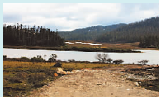
《无极》剧组搭建的栈道(上)已被拆除,并撒上树皮做肥料(下)。