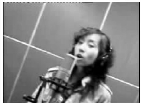
恶搞短片中小女生沐尔演唱截图。