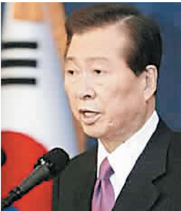
此次是金大中二次访朝,韩方官员称金正日只听得进金大中的话。

双方还同意,将共同举办“8·15”庆典,纪念1945年朝鲜半岛摆脱日本殖民统治,共同振兴民族教育与文