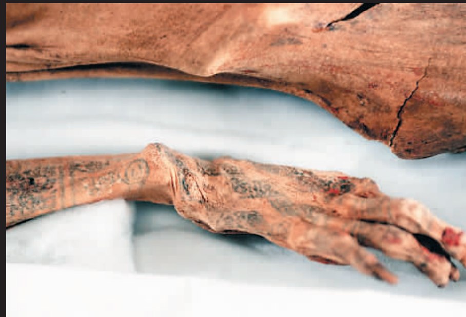
▲这具木乃伊的双臂与身体有内容复杂的文身,与其它被发现的莫切文化文身图案明显不同。