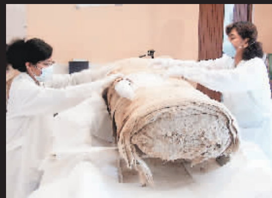
▼考古学家开始研究这具木乃伊。

时报综合报道 美国“国家地理协会”16日宣布,考古学家近日在秘鲁的一个墓地中发现了一具女性木乃伊,与众不同,这具木乃伊的手臂等部位上竟然刻有复杂的文身图案。