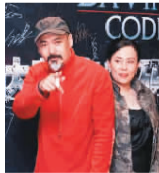
发哥表示自己是来捧偶像汤姆·汉克斯的场。

在香港《达·芬奇密码》的首映仪式，特首曾荫权也特地来捧场，本身为虔诚天主教徒的曾荫权表示，虽然电影内容被指与教会认知相违背，但他相信自己的宗教热诚不会因为看一套电影而改变。此外出席首映的名人还有徐子淇、乐基儿、周迅、徐若瑄、李小冉等。