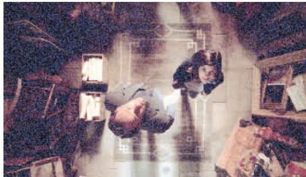
《达》片在戛纳首映，没获得多少掌声却收获一堆劣评。