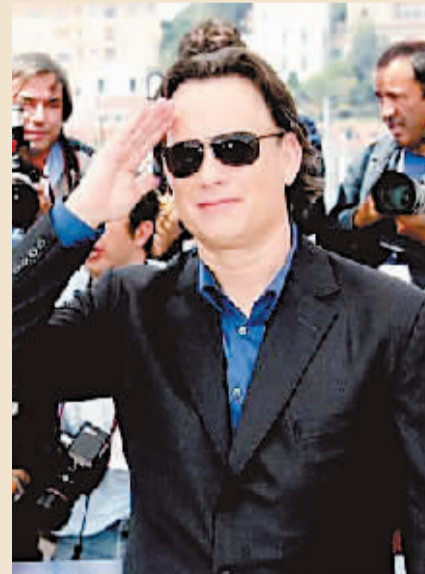
此次戛纳之行，汤姆·汉克斯似乎心情不错，小动作多多还不时开自己的玩笑。