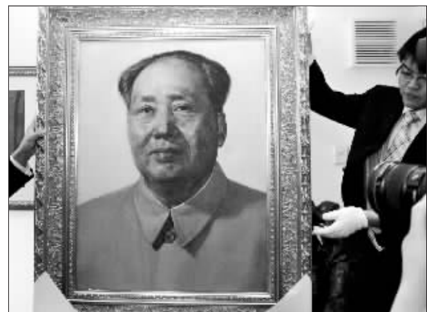
17日,工作人员在介绍《毛泽东像》母本。

台湾《中国时报》16日发表社论说,陈水扁女婿赵建铭涉台开股票内线交易案,恐怕是陈水扁掌权6年以来最严重、最受人质疑、牵连最广、最难以善后的案子。这一案子可能成为台湾政治的分水岭。