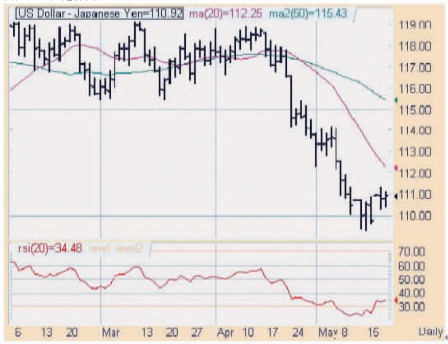
美元兑日元走势图

期大幅上涨44%。日本企业目前多采用提高能源运用效率的办法,以应对高能成本源的冲击,但油价若持续飙升,将开始扭转企业的获利前景。