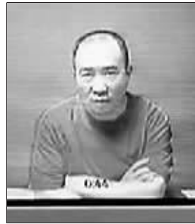
赖昌星昨日通过视频出庭接受被捕后 48 小时内的拘留聆讯。

受到中国司法部门指控和通缉的“远华”走私案重要嫌犯赖昌星于 1999 年举家逃往加拿大。2000 年 11 月,加拿大政府将赖昌星软禁在温哥华郊区一住宅中。2005 年 8 月,加最高法院拒绝赖昌星及其家属的难民身份申请后,加移民部遂启动遣返前的风险评估程序。