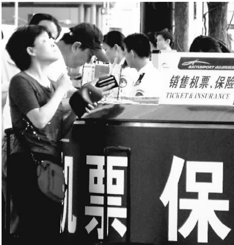
不久,乘客可能在买机票时一起购买航空意外险。

据了解,航空意外险开出第一张保单是在1989年5月1日,自1997年以来,航空意外险在全国大部分地区实行多家寿险公司“共保”,即按照一定比例划分市场份额,出险后按相应份额由各公司赔付。目前,实施的航空意外险每份20元,最高赔付40万元。