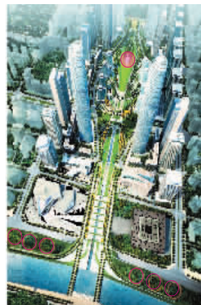
两图中画红圈处将是城市雕塑的位置。