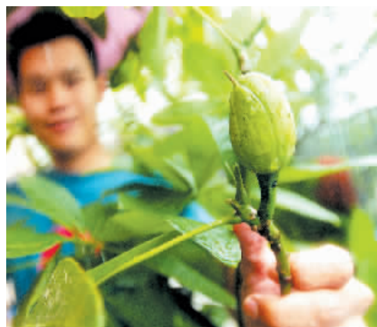
王先生祖父种下的发财树近日结出一枚鸡蛋大小的“发财果”。

(3)不要喝生水或尽量不接触野外的生水,若生水中含有感染性原尾蚴的剑水蚤可直接从皮肤、粘膜侵入感染。