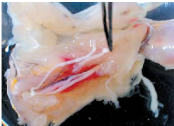
青蛙大腿里分离出活的裂头蚴。(资料图片)

(1)不要局部贴敷生蛙肉等动物肉类。用生蛙肉敷贴在伤口或脓肿上,蛙肉中如有裂头蚴,可自伤口或正常的皮肤、粘膜侵入组织。