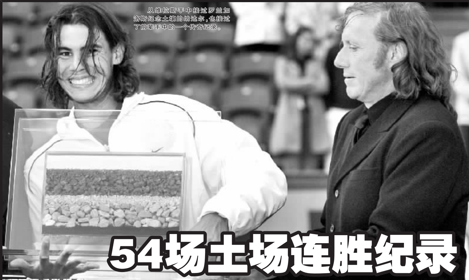
从维拉斯手中接过罗兰加洛斯纪念土壤的纳达尔,也接过了前辈手中的一个传奇纪录。