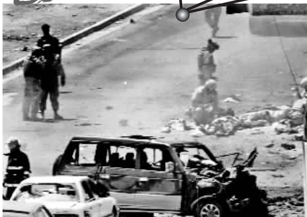
5月29日,在伊拉克首都巴格达的爆炸现场,一名美军士兵在救治伤者。