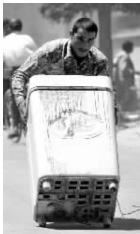
►喀布尔一男子在骚乱中从外国人家中抢得一台洗衣机。

目前,喀布尔市内局势还没有被控制住,街上的商店几乎全部关闭,马路上鲜见行人。在一些政府部门附近可以看到全副武装的阿富汗军警,但很难见到此前经常在市内巡逻的美军和国际安全援助部队的影子。