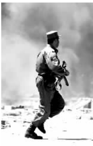
◀5月29日,一名阿富汗警察从首都喀布尔的骚乱现场跑过。