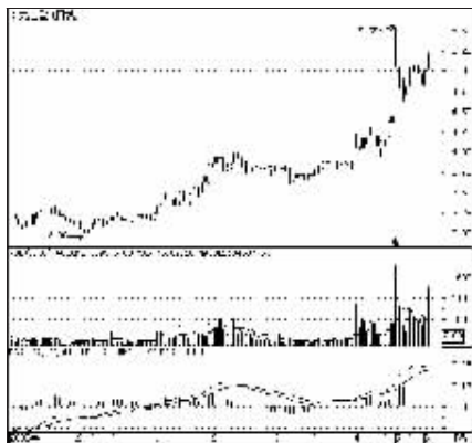
九芝堂日线走势图