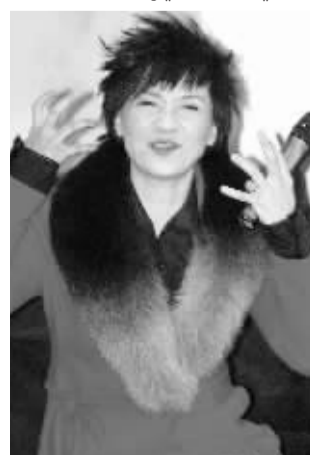
▼柯以敏对超女的点评被网友编成语录。