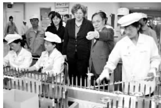
6月2日,美国官员在朝鲜参观开城大工业中心。虽然美国官员可以参观工业中心,但一谈到核问题美国政府就关起直接沟通的大门。

据新华社电 朝鲜外务省发言人1日发表一项声明,重申朝鲜对于朝鲜半岛核问题六方会谈的立场。他在声明中指出,如果美国愿意履行去年9月六方会谈出台的《共同声明》,朝鲜愿意邀请六方会谈美方代表团团长访问平壤。当天晚些时候,美国拒绝朝鲜的邀请,同时要求朝鲜返回六方会谈。