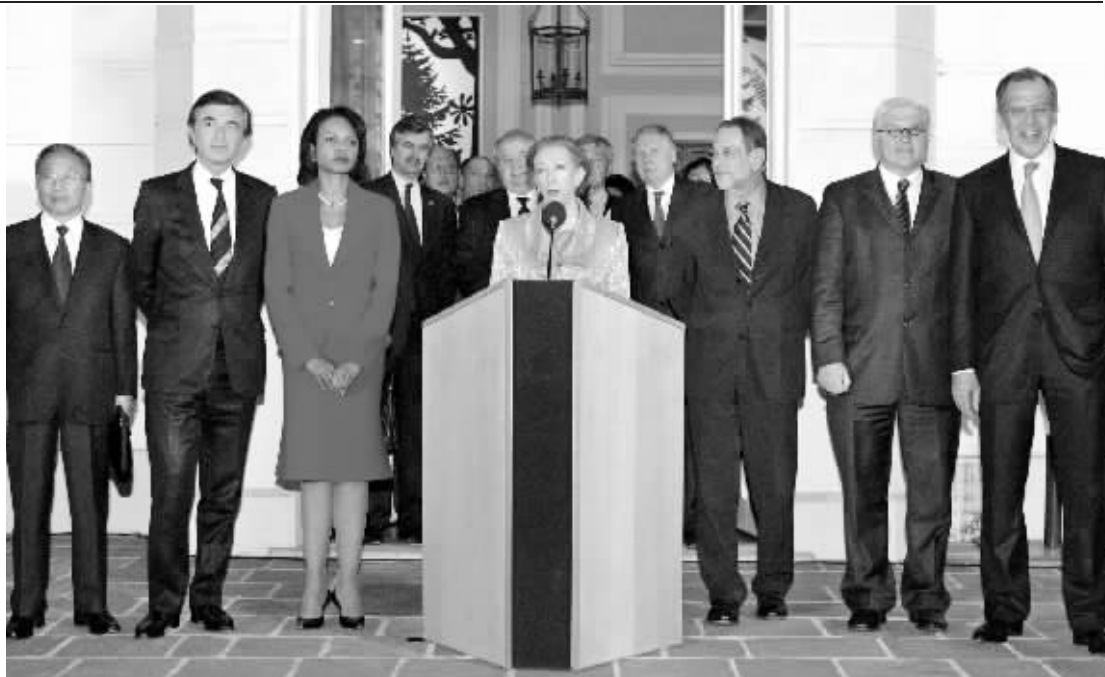
6月1日,中国外交部副部长戴秉国(左一)和其他国家官员出席新闻发布会,英国外长贝克特在宣读声明。

一名美国高级官员说,伊朗只有几星期时间,考虑接受西方国家的建议。此外,俄罗斯外交部长拉夫罗夫2日在莫斯科对新闻界说,俄罗斯、中国、美国、英国、法国和德国将就伊朗核问题与伊方进行直接谈判。