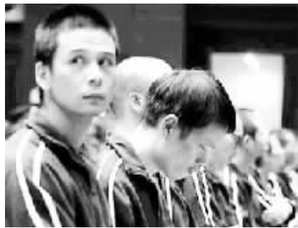
13名被告人在法庭上。