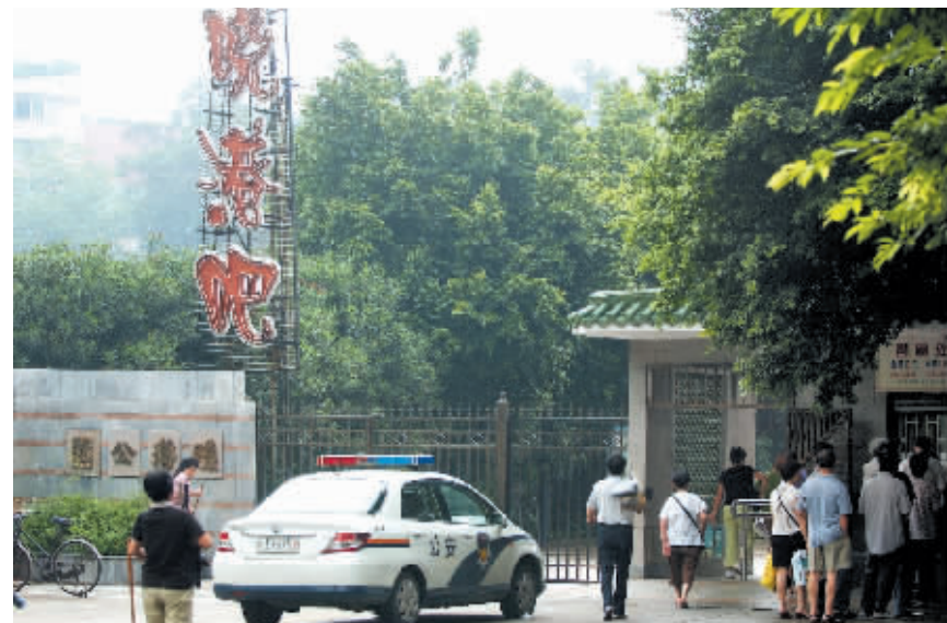
昨日上午近10时,晓港公园正门已恢复平静,仍有警车驻守调查。

据附近某大厦保安介绍,当时,他看见歹徒是从江南大道中隔山村方向跑出,然后跳过路中间的交通护栏,再转进海珠购物中心旁边的小巷,但他没有进小巷而是掉头往穗花新村方向逃窜。追赶其后的4名便衣警察一边向歹徒喊话一边打电话请求支援。就在他们离歹徒近在咫尺时,狡猾