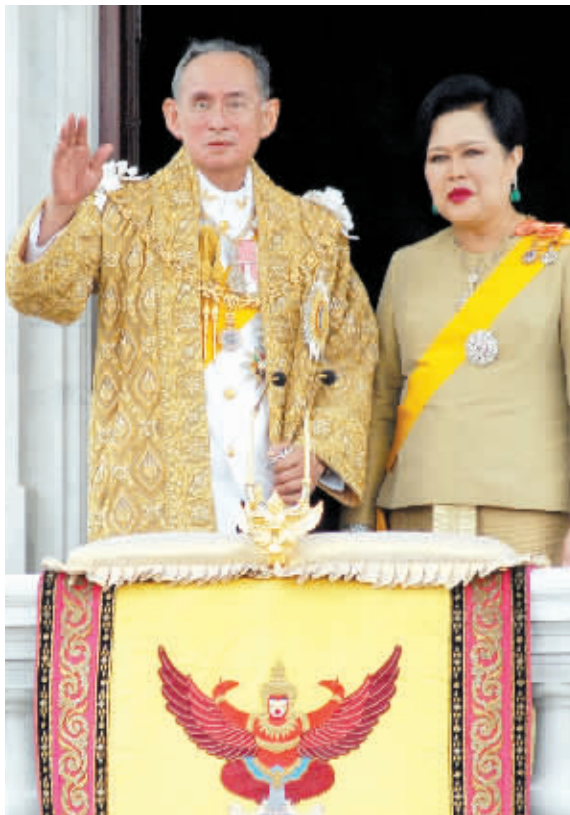
泰王与王后向民众挥手致意。

一系列传统礼仪后,泰王11时出现在王殿南阳台,他对着铜马广场数十万伏地而拜的民众挥手示意,表达谢意。“团结是所有泰国人维护和促进国家繁荣的根本。”泰王在讲话时台下鸦雀无声,不过他没有提及泰国已连续数月的政治僵局。在泰国民主进程历史上,普密蓬国王曾多次出面化解国家危机。