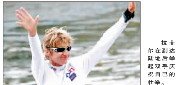
拉菲尔在到达陆地后举起双手庆祝自己的壮举。

时报讯 据《中国日报》报道,对于46岁的法国人拉菲尔·古韦洛来说,她最大的乐趣莫过于驾帆船穿越海洋。继征服大西洋、地中海和太平洋之后,近日她又完成了横渡印度洋的壮举,成为驾帆船穿越印度洋的第一人。