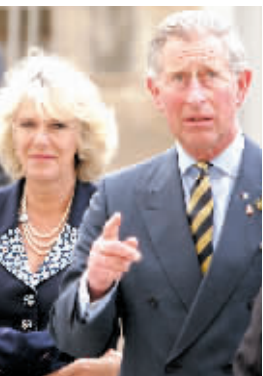
查尔斯的发言人发表声明称:“他们的婚姻是合法有效的。这不会对王储继承王位带来任何障碍。”

时报讯 据《中国日报》报道,正当英国王储查尔斯与妻子卡米拉沉浸在结婚一周年的幸福时光时,英国媒体6月9日却给这对“苦命鸳鸯”泼了一盆冷水,称两人的婚姻不合法。