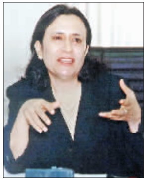
这位女律师将在即将到来的联合国秘书长选举中起什么作用,让人拭目以待。

机构之一,由会员国组成。联合国宪章规定,联大无权讨论宪章范围内任何问题或事项,并向会员国和安理会提出建议。联大决议与安理会决议不同,它没有约束力,但在一定程度上代表国际社会多数意愿。