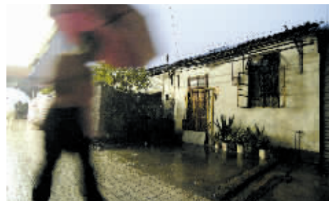
海珠区厚德路肉菜市场正门前的两幢平房开裂,住户已全部撤离。

“可以把这些简易平房当作危房对待。”当地街道办城管工作人员说,由于长时间来雨水连绵,考虑到两幢平房随时会出现垮塌的危险,住户们必须安全撤离。在肉菜市场的数名档主说,这两幢平房是外地人员租住在这里的,当时城管人员来时,住户还不愿意搬走,经过城