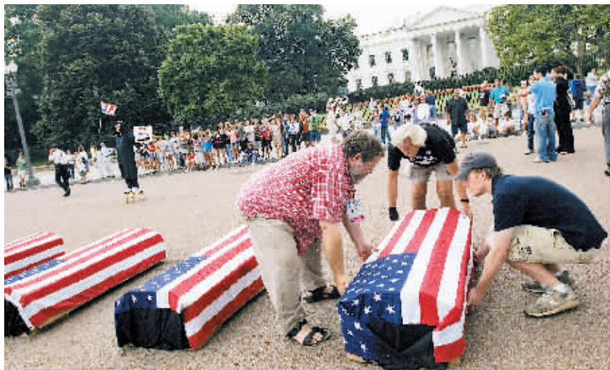
6月14日,示威者把象征着死亡的驻伊美军的假棺材抬放在白宫前进行抗议。

美国《华尔街日报》和全国广播公司15日联合公布的一项民调显示,尽管布什政府前一阶段受到扎卡维被炸死、伊拉克政府完成组阁等多个“利好消息”的刺激,但布什的支持率却仍