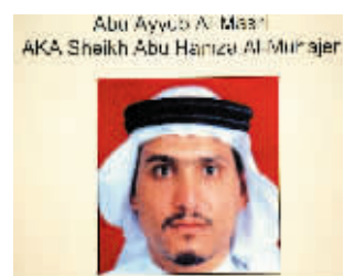
这是美军公布的马斯里的照片,他蓄有胡须,头戴白色的阿拉伯头巾。

马斯里和扎卡维在“基地”组织阿富汗训练营中相识。两人先后来到伊拉克,马斯里成为扎卡维得力助手。2004年底,美军围攻费卢杰时,马斯里和扎卡维一起逃出美军包围。