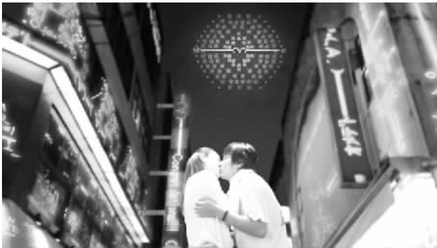
《电车男》演绎的爱情故事突显网络亲友团的力量。

最终,“电车女”的言语真诚打动众多网友,现在每天都有网友根据“手机欠费停机中”的条件提出自己的看法,甚至有网友专门开通电车女QQ群和电车女亲卫队。在众网友帮助下,“电车女”逐渐由一个不太自信的女孩变得越来越自信、美丽,且成功制造几次特别的相处机会,如“画廊巧遇”、“办公室借书”、“端午送粽”,每一步都得到众网友热心指点,精心策划。现在,每天仍然有许多网民登陆论坛,盼着“电车女”汇报进程,一旦回复不及时,按捺不住内心的紧张网友就胡思乱想,一旦“电车女”翩然而归,论坛又