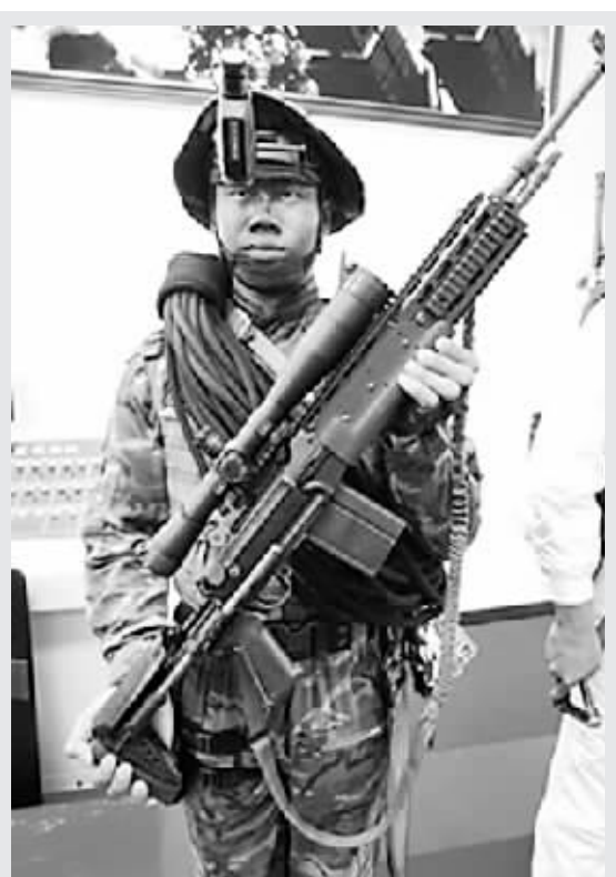
2005年台军“汉光21号”演习中持老式美制M14步枪的特种兵。