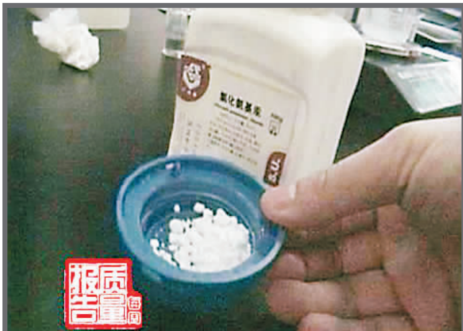
广州薇姿化妆品有限公司车间里,正在生产一种祛斑洗面奶。一瓶原料正是氯化氨基汞,上面印着“毒品”的警示标志。