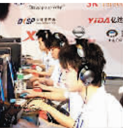
IEF2006 中韩对抗赛 CS 项目冠军 wNv.gaming。

时报讯 IEF2006 中韩对抗赛经过 2 天的激烈争夺于 6 月 23 日圆满落幕,在中韩明星对抗赛中,中国 CS 王者之师 wNv.gaming 保持着 CS 项目的绝对优势,以 16:4 轻松拿下对手,可魔兽、星际项目仍和韩国存在着一定差距。最终中国队以 1:2 不敌韩国,继 CKCG2005 中韩对抗赛后再次落败。