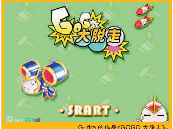
G-fire 的作品《GOGO 大脱走》。