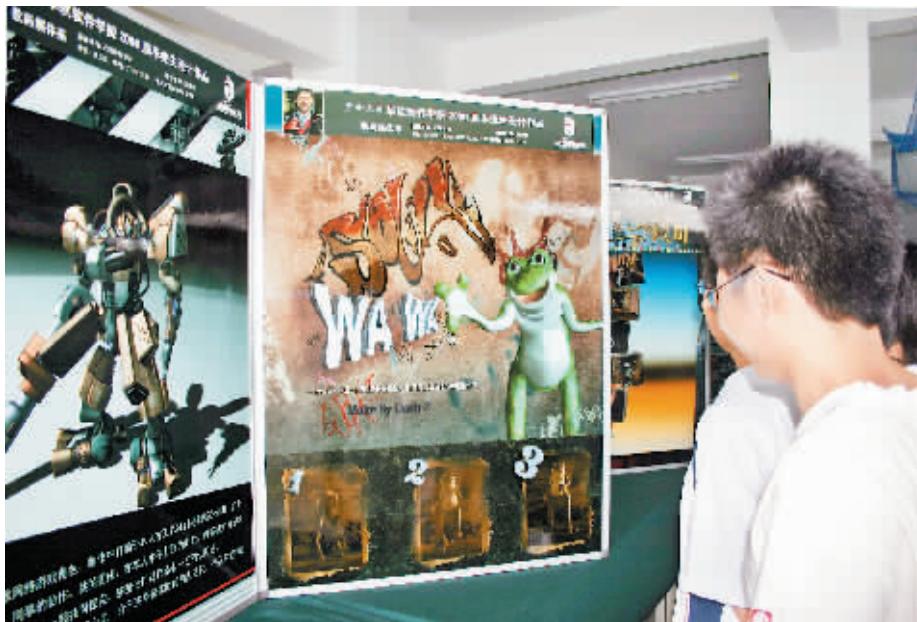
尽管游戏厂商开出高薪,但应聘的人还是寥寥无几。

像出版司副司长寇晓伟介绍,国内网络游戏市场保持较高增长势头,2005 年全年产值为 37.7 亿元人民币,增幅超过 52.6%。而有统计数据显示,目前国内游戏玩家超过 3000 万人,但研发核心环节的人才不足 3000 人,游戏核心研发人才缺口高达 20 万。