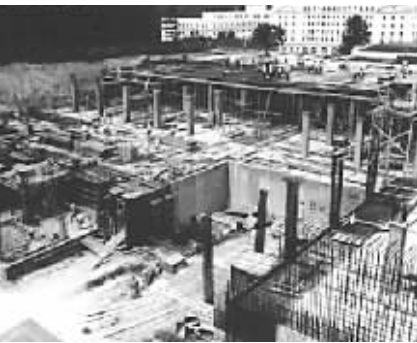
地堡国会1960年兴建的施工现场。

专为客户提供电子工程的服务。他们表面上承包了绿蔷薇酒店的影视服务,但其实八成时间都是为地堡工作。