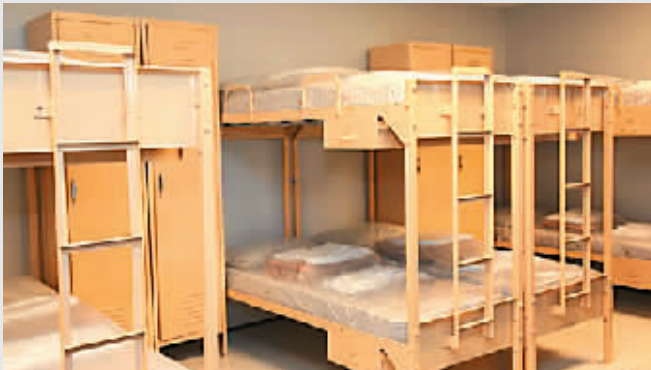
▲每间宿舍里放的全是高低床,如同学生宿舍,可容纳60人。