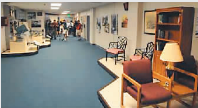
▲身处重要职位的众议员和参议员有专门的套间,居住起来更舒适些。