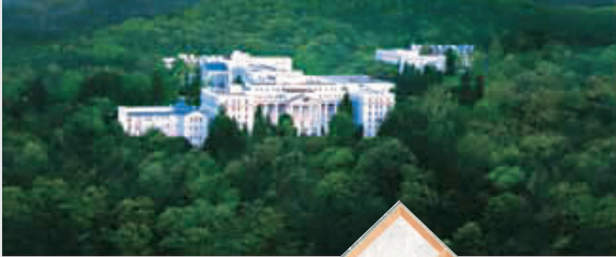
▲表面平平无奇的绿蔷薇酒店暗藏“防核地堡国会”。左上小图为酒店入口,与美国国会大厦外观很像。