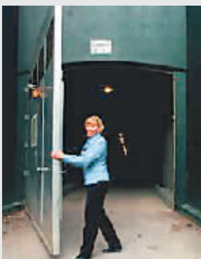
▲通往地堡的防爆门重25吨。