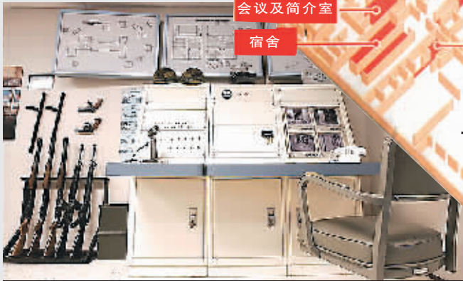
▲广播室(备有枪支、闭路电视和广播系统)