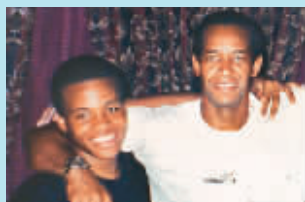
约翰·艾伦(右)和马尔沃。

兰州和弗吉尼亚州共发生了14起枪击事件,共有10人在这一系列事件中被打死,4人受伤。10月24日,约翰·艾伦·穆罕默德及其17岁的继子李·博伊德·马尔沃被捕。2003年12月23日,美国连环枪击案凶手、18岁的马尔沃被陪审团判处终生监禁且不准假释,而他的养父约翰·艾伦·穆罕默德被判处死刑。