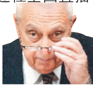
沙龙至今仍未苏醒。