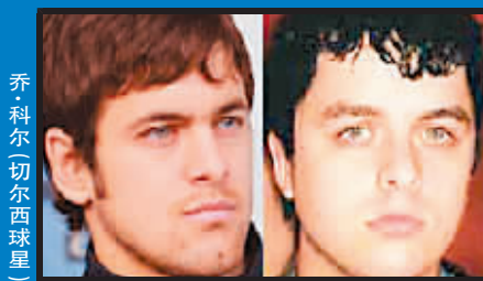
比利·乔尔(切尔西球星)