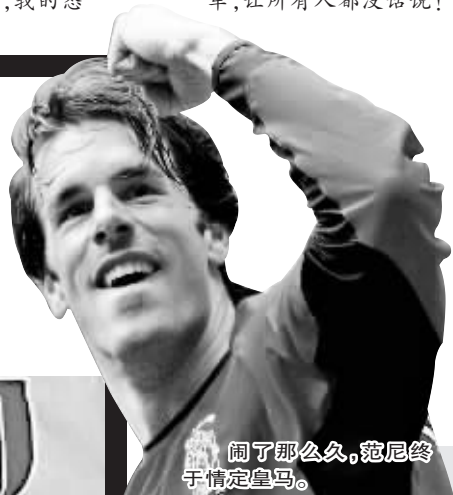
闹了那么久,范尼终于情定皇马。

部主席马特要求欧洲足球首脑立场坚定,不让参与足球腐败活动的AC米兰队参加下个赛季欧洲冠军联赛。他表示,AC米兰参与了意大利足坛的假球黑哨活动,如果还让AC米兰队参加下个赛季的欧冠联赛将是“难以置信的事情”。