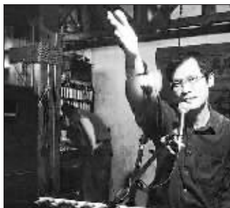
台湾民谣的早期旗手罗大佑

1982 年罗大佑《之乎者也》和陈永裕、李宗盛组成的木吉他合唱团出的专辑也代表了台湾校园民歌的最高水平。不久,段钟潭与段钟沂以原滚石杂志为基础,开办了台湾滚石唱片公司。民歌时代极具影响力的张艾嘉转投滚石旗下,初出茅庐的罗大佑成为制作人,于是有了《童年》里无尘清水般的声音。有些作品以极富现代韵味的编曲、录音手法,让人耳目一新。这些作品无疑独辟蹊径,为国语音乐的发展拓宽了视野,并从此奠基了台湾现代音乐的基础。