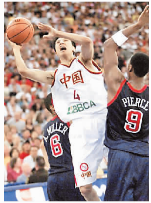
2002年世锦赛是中美对抗分差最小的一次。