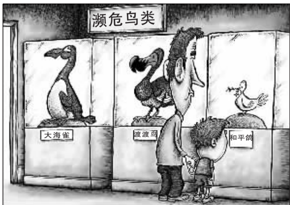
▲大战未止，小战又生，看来中东没有适合“和平鸽”生存的土壤。