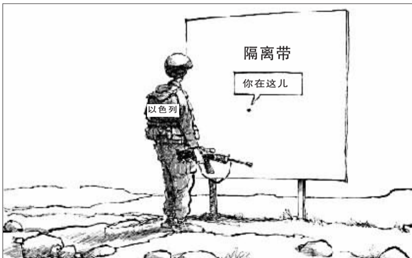
▲以色列称要黎以边境开辟出安全区作为遏制真主党火箭弹攻势的缓冲，而在很多人看来，国土狭小的以色列提出30公里安全区的计划不切实际。