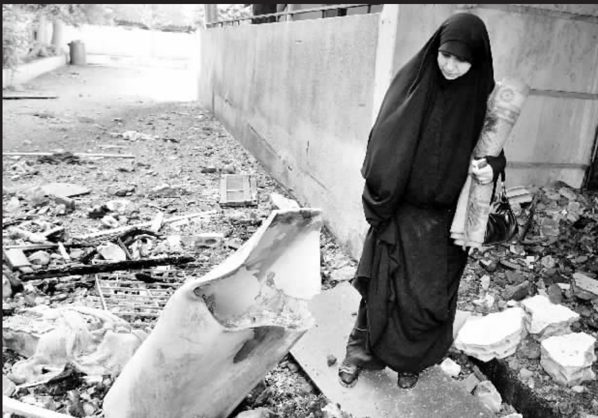
一名黎巴嫩妇女在以军空袭后留下的炮弹残骸前驻足了很久,她的身后是大量被炸毁的民宅。

据黎巴嫩统计报告显示,以色列对黎巴嫩24天的袭击轰炸已造成黎境内至少967人死亡、3293人受伤。报告显示,死亡者中包括880名平民,其中30%是不满12岁的儿童。另外,黎真主党方面有48人死亡。报告还说,目前统计出的死亡人数不包括埋在废墟下尚未找到的人。