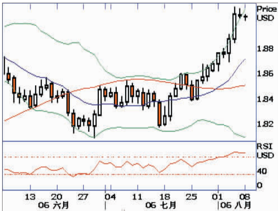
英镑兑美元走势图

除美元利率趋势外,目前市场正在关注国际能源价格攀升对美国构成的冲击程度。本周一美联储公布的数据显示,因信用卡借贷大增,6月美国消费者信贷增加102.7亿美元,高于预期的增长40亿美元,5月消费者信贷则上调至58.8亿美元;6月消费者未偿付信贷升至2.186万亿美元,以年率计较前月的2.176万亿美元增长5.66%;6月包括信用卡在内的循环信贷总额上升9.80%至8206.5亿美元,5月为增长11.04%;6月非循环信贷总额增长3.19%至1.366万亿美元,前月为下降1.35%。非循环信贷包