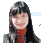
大户室手记 唐春瑜

上周五,美国公布了强劲的7月零售销售数据,令市场猜测美联储可能无法长期维持利率不变。美元全面上升,兑欧元最高升至1.2713,兑日元最高至116.44。