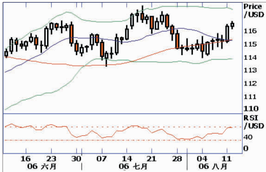
美元兑日元走势图

经济 日本经济持续扩张,发展情况与我们预设看法一致,GDP数据显示,日本经济在内需引领下正稳定复苏。至于展望,可能会持续长期性增长,受惠于正面的收入(增加)与消费,而这些与我们在展望报告和中期评估中所预测的一致。 市场 自日本央行7月加息以来,金融市场大致稳定,我认为这证明日本央行有关货币政策的看法已经被市场人士所接受。 随着日本6月经季节调整工业生产较上月增长2.1%,以及日本国内通胀率的上升,笔者认为,日本央行在年内进一步提升日元利率的机率增加。 技术分析 尽管市场推测日本央行在年内进一步提升日元利率,但并未能给日元汇价带来积极的支持。相反,由于美联储对美元利率的走向态度不明朗,令市场推测美联储并未真正终止美元利率上调。因此,美元利率在年内上调的可能性仍然存在,对美元汇价构成了支持。