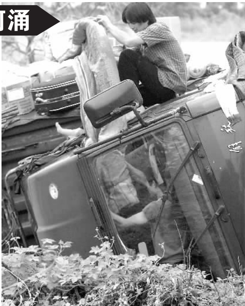
两男子在把驾驶室内的铺盖等物品拖出来。