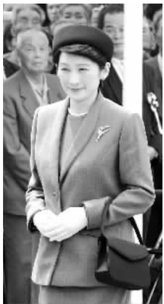
纪子妃5月份出席一个公开活动的照片。

据悉,纪子已经为文仁亲王生下两女,这是她的第三胎。纪子此次生产可谓“意义重大”。因为日本皇室40年来一直没有男性子嗣出生,皇室上下、甚至是全日本都盼望纪子王妃能生下一个男孩,从而解决没有男性皇室继承人的难题。 亮亮