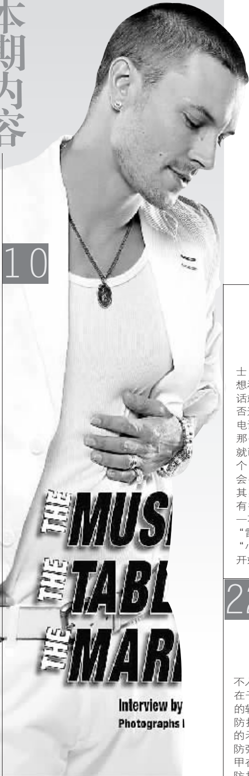
Interview by Photographs I