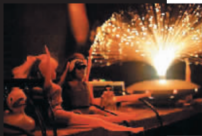
▲在古代建筑风格的吧里体验卢布尔雅那的夜生活。