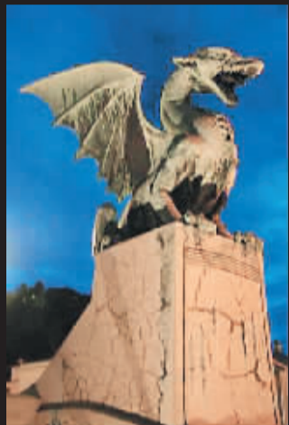
▲龙是卢布尔雅那的标志,到处可见。