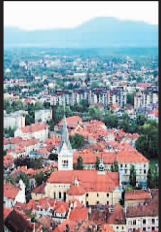
旧城区内的房屋保留了中古外貌,古雅非常。