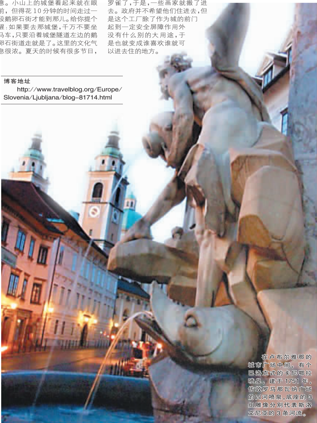
在卢布尔雅那的城市广场中间,有个巴洛克式的卡尼鄂拉喷泉,建于1751年,仿效罗马那瓦纳广场的四河喷泉,底座的3组雕像分别代表斯洛文尼亚的3条河流。