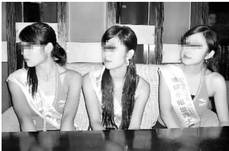
3名地球小姐参赛选手羞于谈起被迫陪客人喝酒之事。