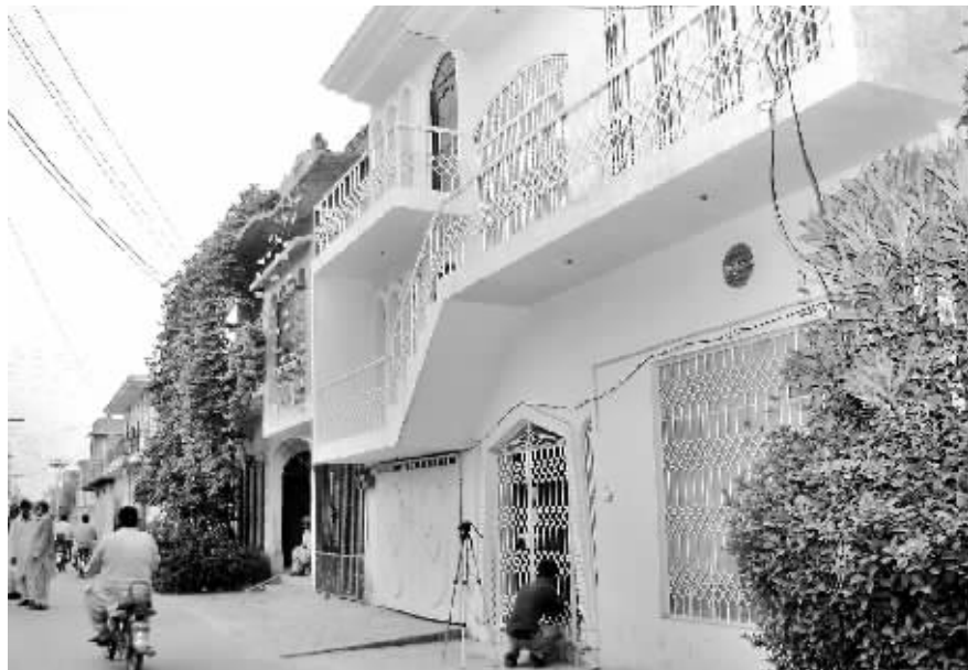
拉什德在巴基斯坦中东部城市木尔坦附近拥有的一栋房屋。