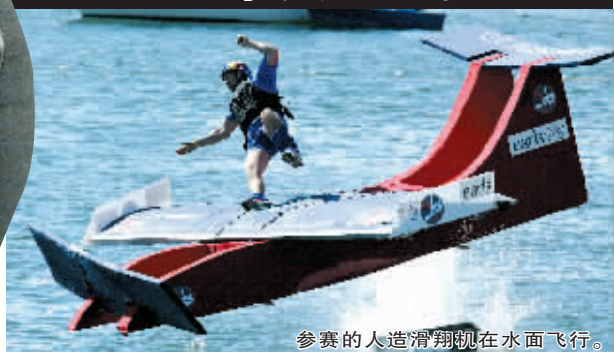
参赛的人造滑翔机在水面飞行。

8月19日,加拿大城市温哥华举行了“飞行日”。根据赛会要求,参赛的各种飞行器必须是参赛者亲手组装制作的。飞行器不能大于9.1米,不得超过204千克重,并且只能使用人力驱动。