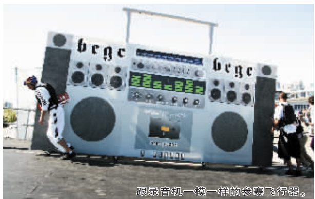
跟录音机一模一样的参赛飞行器。

8月19日,加拿大城市温哥华举行了“飞行日”。根据赛会要求,参赛的各种飞行器必须是参赛者亲手组装制作的。飞行器不能大于9.1米,不得超过204千克重,并且只能使用人力驱动。