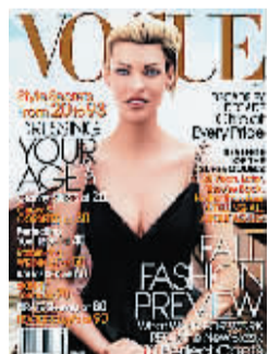
琳达·伊万格里斯塔登上8月号的《Vogue》杂志封面。

作为上世纪80、90年代曾红极一时的超级名模,41岁的琳达·伊万格里斯塔早前以怀孕之身登上8月号的《Vogue》杂志封面,这一举动,也打破了过去一年多来好莱坞明星垄断《Vogue》封面人物的局面。对于琳达的回归,美联社把这当成个大事,几大新闻网络不吝力气地报道。毕竟新人露面,可以说是预示着某某时代或风潮的兴起;旧宠回归,莫非意味着复古风的前兆?不管怎样,当同时期的超模都已经逐渐淡出人们的视野时,琳达还能活跃在舞台上,不得不说这确是一个不老的神话。