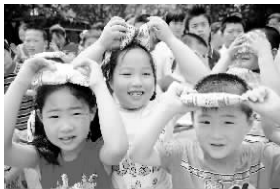
两大乳业巨头瞄上了广东庞大的市场。

时报讯 (记者 李鹤鸣) 记者昨日获悉,国内两大乳品企业蒙牛、伊利已先后在广东筹建其乳品生产基地,意欲长期扎根广东。有业内人士表示,此举将使两大乳品企业在广东的产品成本大大降低,对本地奶制品企业有着不小的冲击,华南市场的奶源基地争夺将更加激烈,并可能进一步影响未来华南乳品市场的格局走势。