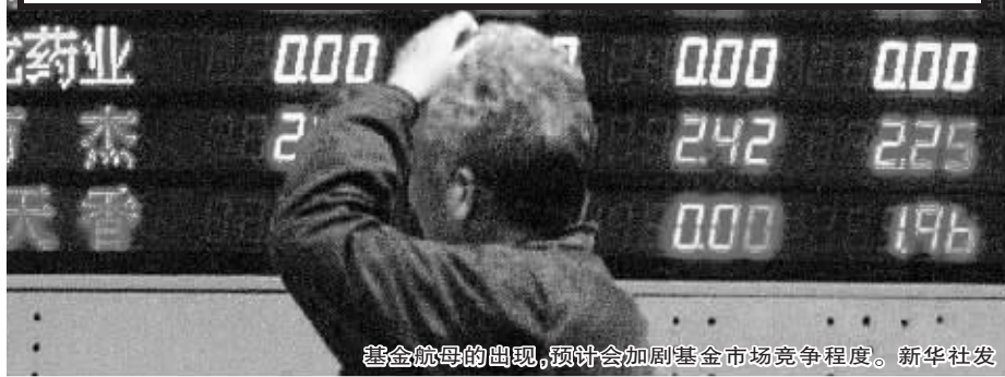
基金航母的出现,预计会加剧基金市场竞争程度。

也有业内人士指出,作为第一起基金公司间的并购案,华夏基金与中信基金合并在今后具体操作中会遇到障碍。一般来讲,正常的并购是强者并购弱者,而中信基金仅仅因为股东结构的变化(中信证券的强大)而去收购一个比自己更强势的华夏基金,这其实是一种“逆向收购”,因此整合过程将十分复杂。