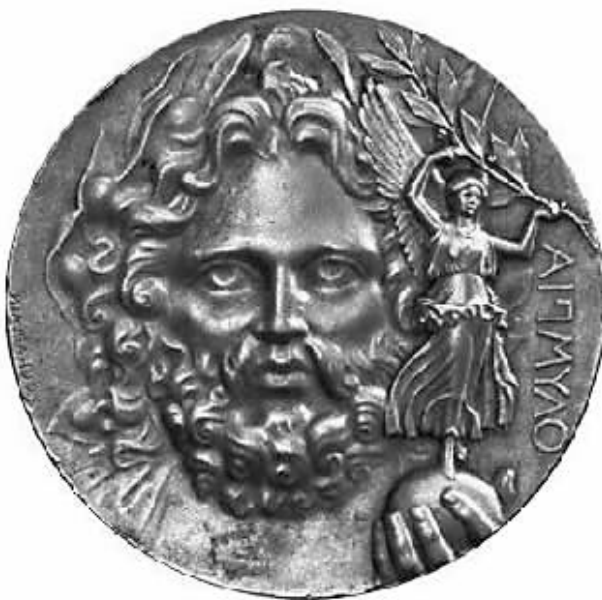
▲ 1896年希腊雅典第一届奥运会奖牌