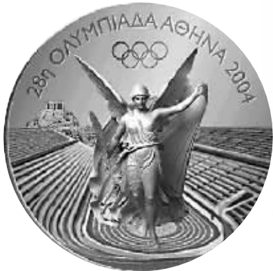
▲ 2004年希腊雅典第二十八届奥运会奖牌

图图教父酷爱用图说话,而且都是一组一组的。那一组历届奥运奖牌,每一届都有一个城市的风格,看着这些奖牌就像巡视了奥运会的悠长历史。看着它们,等待北京2008。