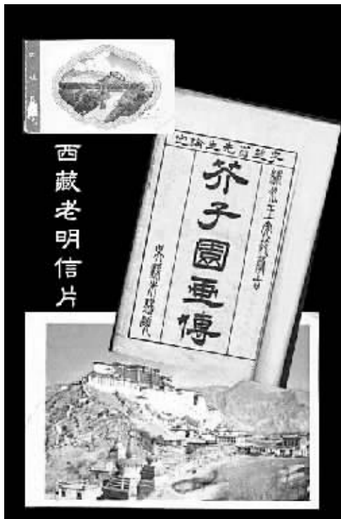
▲ 芥子园画传 光绪戊子年1877年版 外文出版社1955年第一版西藏和平解放明信片