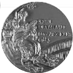
▲ 1984年美国洛杉矶第二十三届奥运会奖牌