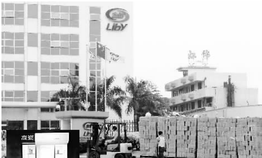
收购了“高姿”这个现成的护肤品品牌,立白可以正式进军这个行业。

据苏宁电器连锁发展总部执行总裁蒋勇透露,年底前还将安排200家新开店和100家改造店的任务。